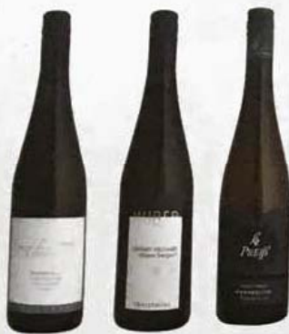
Grüner Veltliner Traisental DAC

Den Jahrgang 2015 können die Winzer des Traisentals als vollen Erfolg verbuchen, der Witterungsverlauf spielte ihnen voll in die Hände. Die heißen Tage des Sommers wurden durch die kühlen nächtlichen Luftströme des Voralpengebiets in volle Traubenaromatik verwandelt und sorgten dafür, dass die Säurewerte nicht zu stark absanken. Das Ergebnis sind fruchtbetonte und nicht zu kraftvolle Klassikweine, die von einer lebendigen Struktur profitieren. Die leichteren Weine des aktuellen Jahrgangs geben sich bereits alles andere als zugeknöpft, aber das bedeutet keineswegs, dass sie nicht über die regionstypische Lagerfähigkeit verfügen. Im Gegenteil: Wer ihnen jetzt noch widerstehen kann, der wird sie spätestens im Herbst so richtig aufblühen sehen. Die Grünen Veltliner besitzen großen Charme, aber auch die nötige Würzigkeit, die Rieslinge strotzen nur so von Steinobstnuancen und sind geprägt von einem festen Säurekern. NOTIZEN VON PETER MOSER